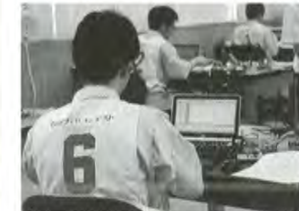
▲電子回路組立部門