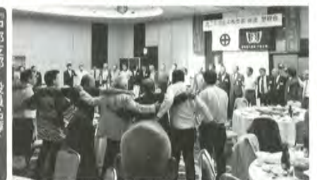
2017年6月支部総会 名鉄グランドホテル